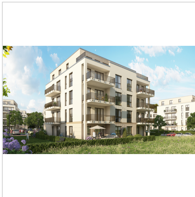
Vastbau - 9 appartementen Naue

Nur 10 Autominuten von Nauen entfernt befindet sich das B5 Designer Outletcenter und der bekannte Karls Erdbeerhof.